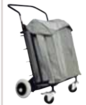
distriFACT ® 4 Housse