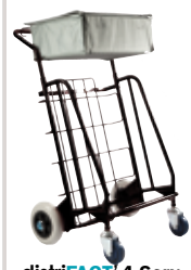
distriFACT ® 4 Serv